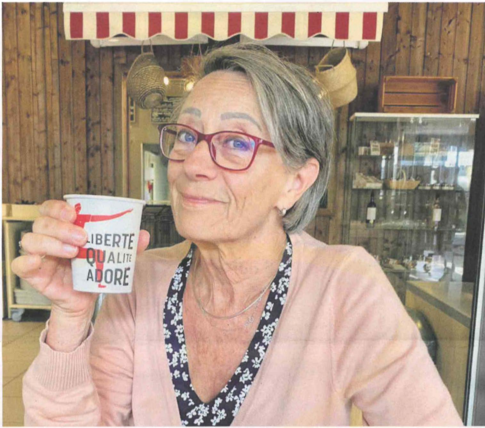
Vrijwilliger Hospice Kajan Fia

“Weet je nog? vroeg mijn man. Ik had die dag bij toeval iemand ontmoet die vrijwilligerswerk deed in een hospice. Hij herinnerde mij eraan dat ik altijd heb gezegd dit ook te willen doen wanneer ik er tijd voor zou hebben. De volgende dag heb gebeld met hospice Kajan. Dat is een klein jaar geleden.”